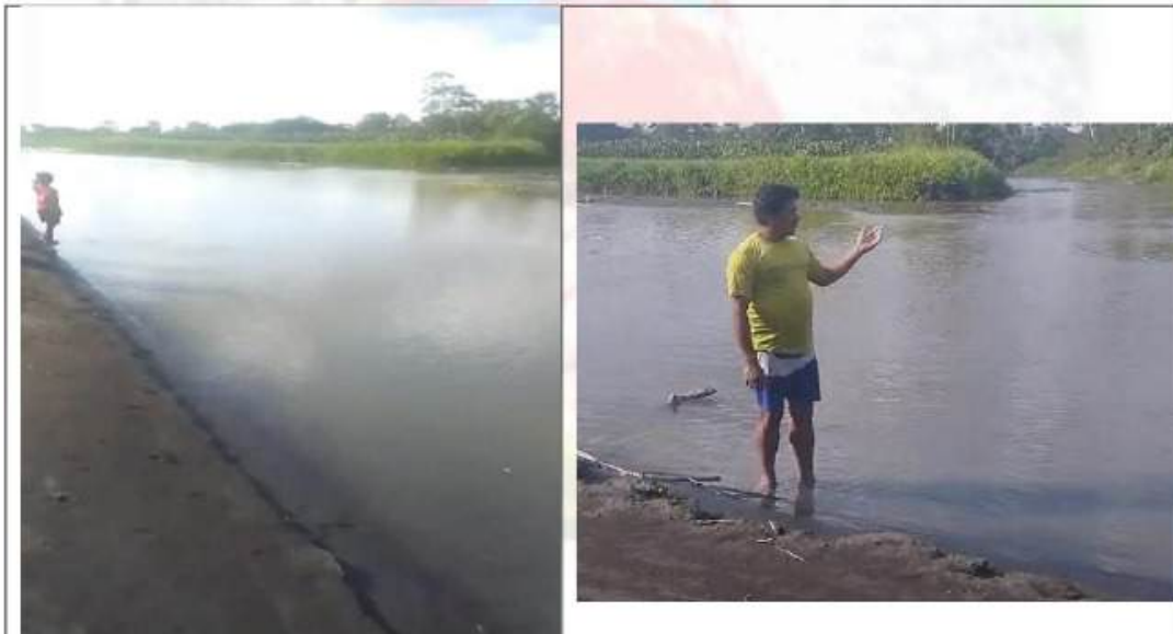
Cochas en la Comunidad de Siwin, territorio del Pueblo Achuar-FENAP.

ALERTAMOS la situación crítica del derrame petrolero ocurrido el 3 de octubre del presente año, en el Kilómetro 11 del Oleoducto Norperuano, en la cuenca del Alto Pastaza, el cual se ha extendido a varios puntos de nuestro territorio. En particular, DENUNCIAMOS que el derrame petrolero se ha esparcido hasta nuestras cochas , en la Comunidad de Siwin, las mismas que venimos inspeccionando, y se encuentran totalmente contaminadas. Las cochas son nuestra principal fuente de alimentos y agua, debido a su contaminación, actualmente no podemos acceder a ellas.