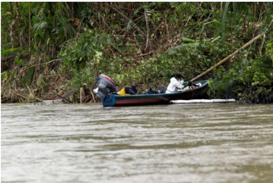
Fotograma 6: ¿Tecnología de punta?