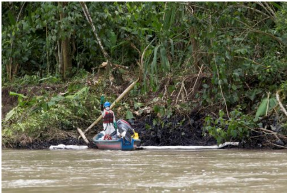
Fotograma 4: Trabajos de recuperación manual de crudo con equipo básico