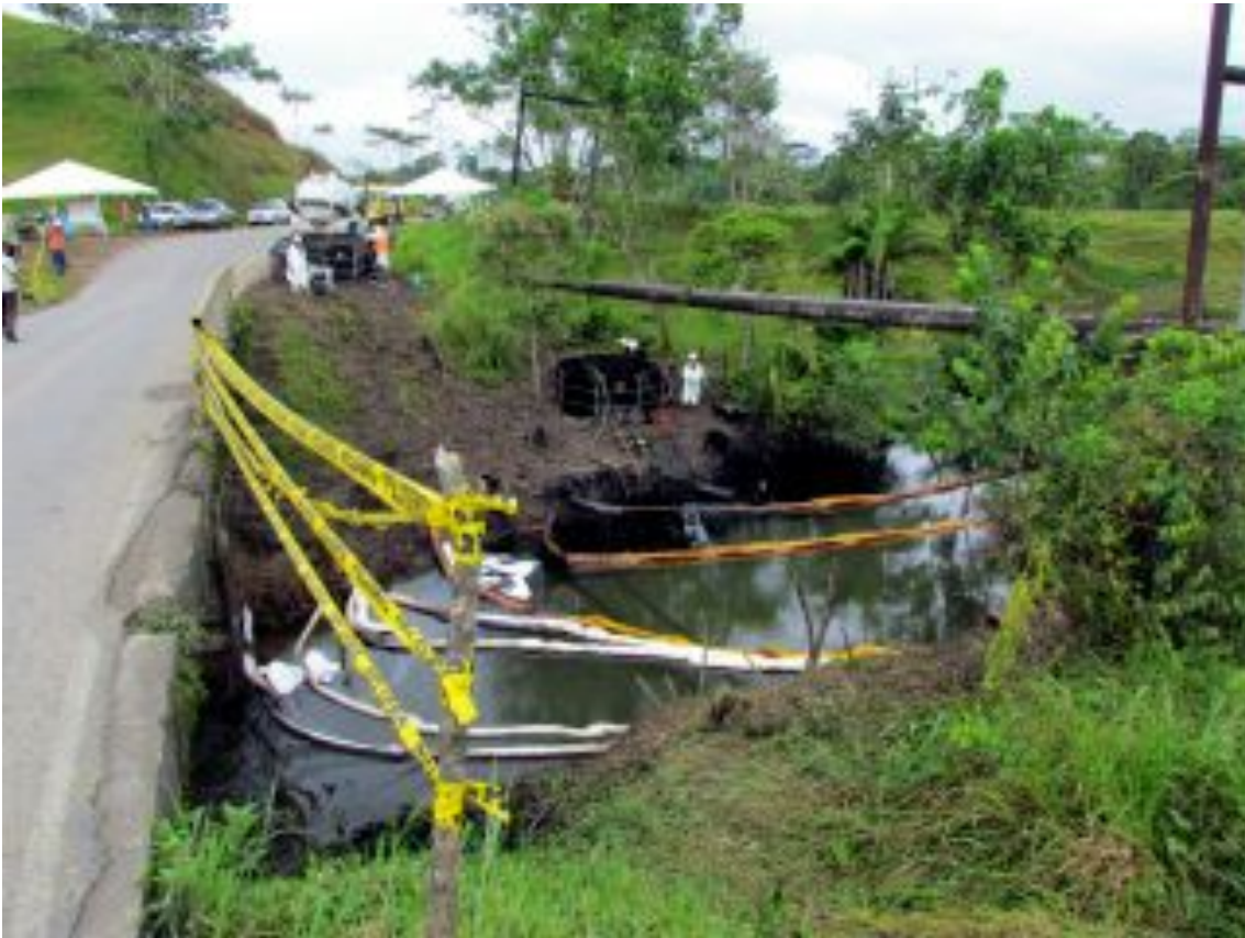
Fotograma 1-A: Sitio del desastre 3 días después