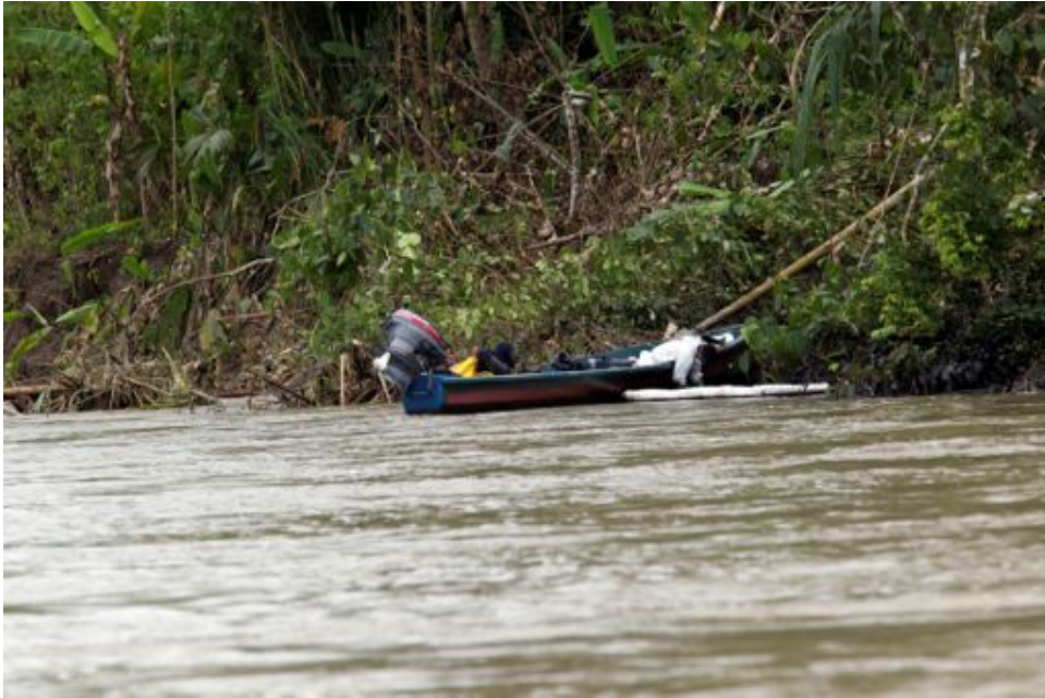
Fotograma 5: Recuperación Manual de crudo ¿tecnología de punta?