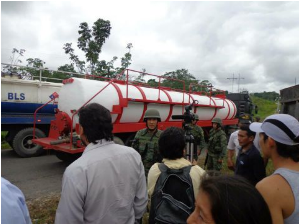
Fotograma 3 A: Militares custodiando el sitio e impidiendo registros fotográficos.