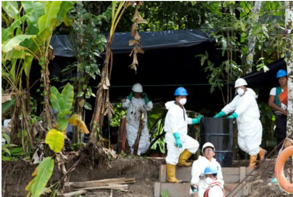
Fotograma 3: Trabajadores de Petroamazonas con equipos de protección básica