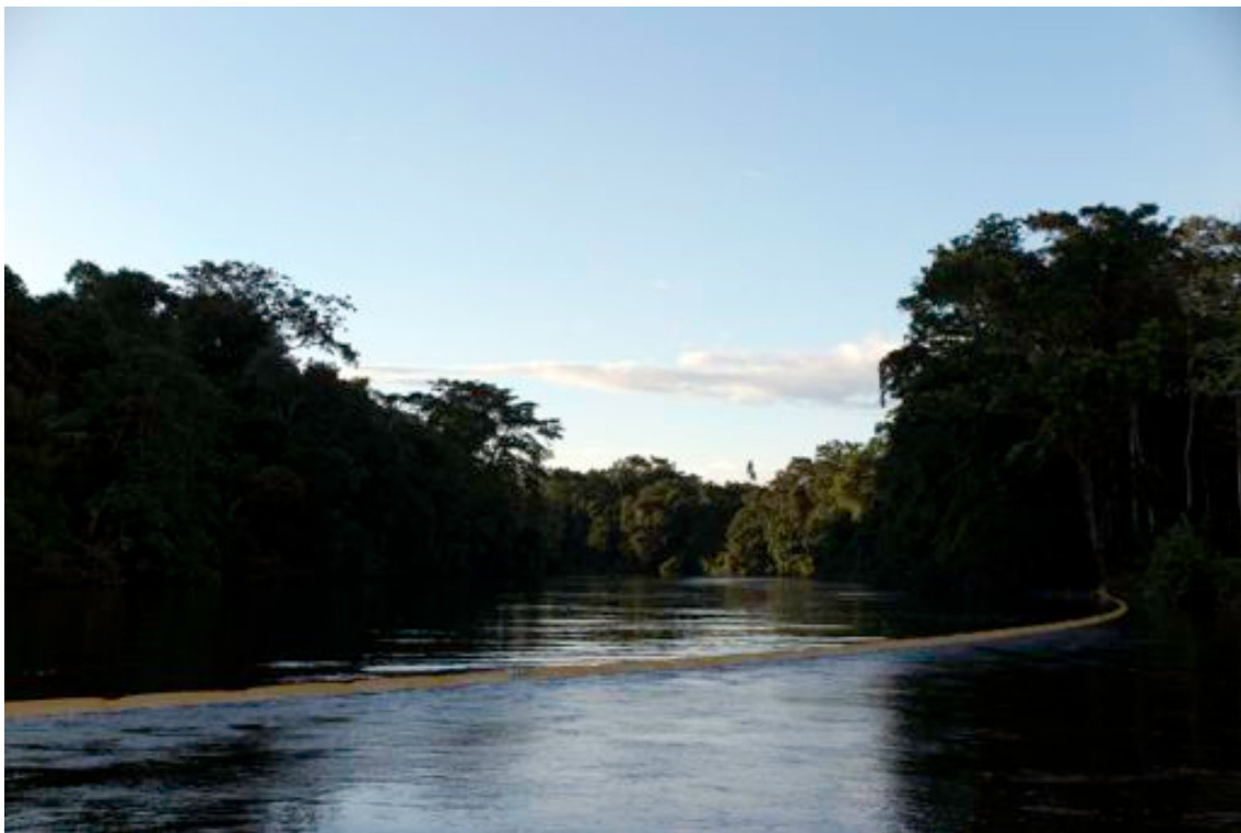
Fotograma 10 : Barrera de Contención a la altura del Río Zábalo en el corazón de la RPF-Cuyabeno