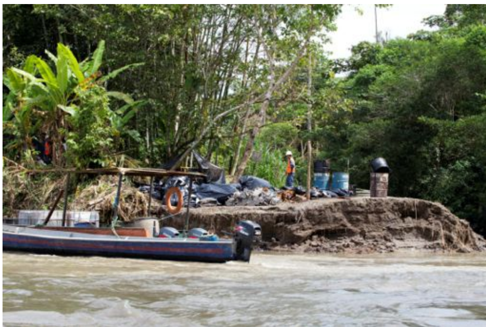
Fotograma 2: Trabajos de recuperación manual de crudo