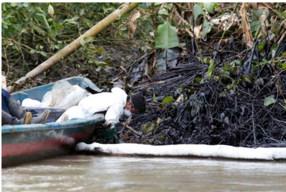
Fotograma 7: Trabajador en área de desastre