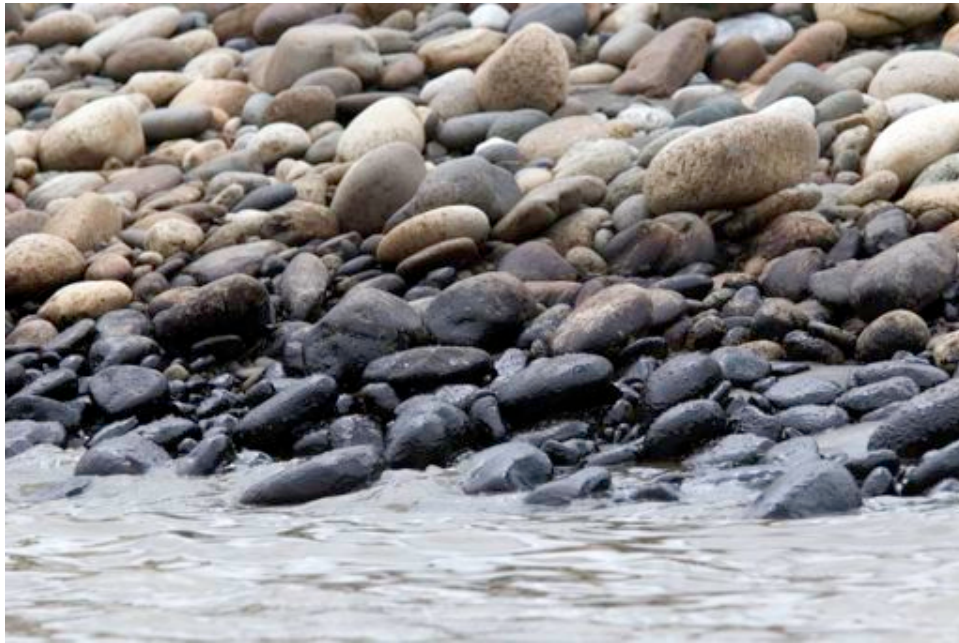
Fotograma 9: Crudo en piedras de Río Aguarico.