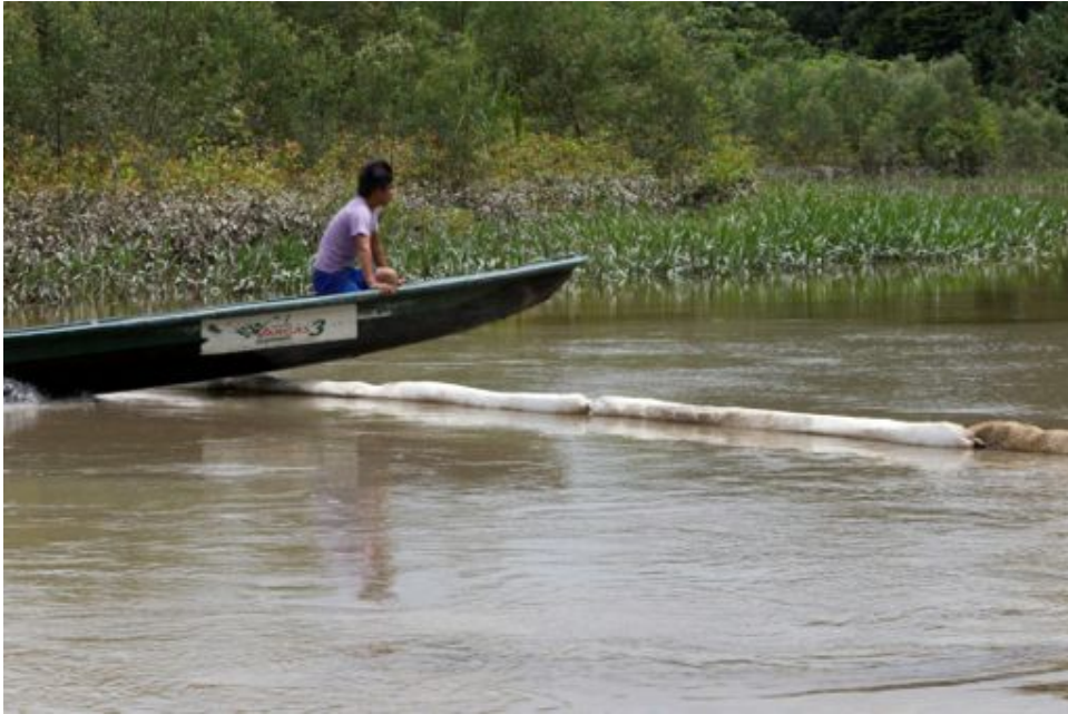
Fotograma 11: Río Zábalo Barrera de protección fácilmente vulnerable.