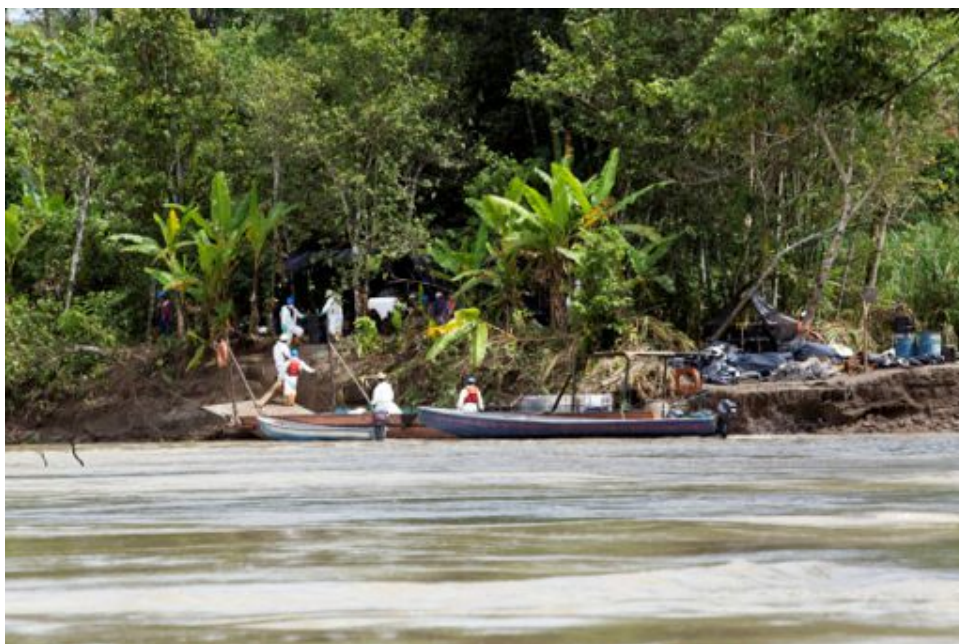
Fotograma 1: Trabajos de recuperación manual de crudo Localización: 18 N 0326828 UTM: 0027449